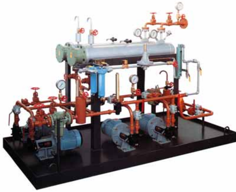
%100 Yedekli FPI (Yedekli Filtreleme, Pompalama ve Isıtma Grubu) / Pumping Group (Double System)