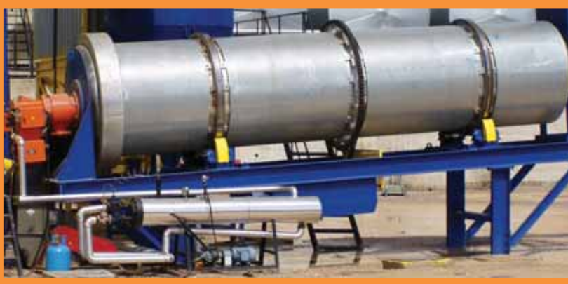
Kızgın Yağ Eşanjörü / Hot Oil Heat Exchanger