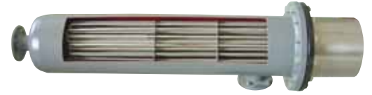
Elektrikli Eşanjör / Electrical Heat Exchanger