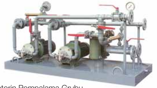
Motorin Pompalama Grubu Light Oil Pumping Station